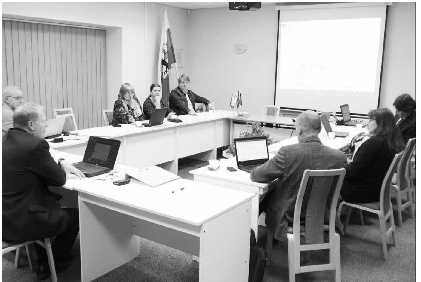
Ühinemise juhtkomisjoni koosolek Tamsalu vallamajas.

Tapa valla ning Tamsalu valla ühinemine toimub 2017. aasta kohaliku omavalitsuste