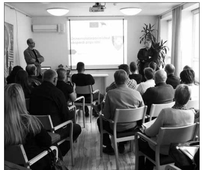
Ühinemislepingu arutelul Laululinnu Külalistemajas olid koos Tamsalu ja Tapa vallavolikogu liikmed.