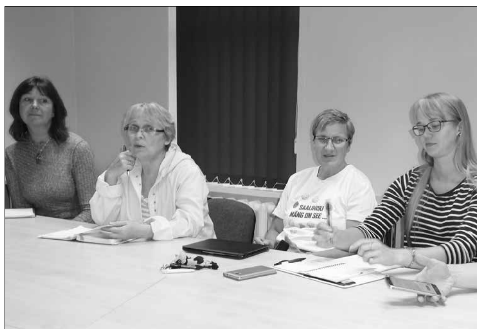
Ühinemislepingu projekti valmimise panustasid komisjoni ja töörühmade liikmed, lisaks töökoosolekutel osalemisele, ka palju oma isiklikku aega.