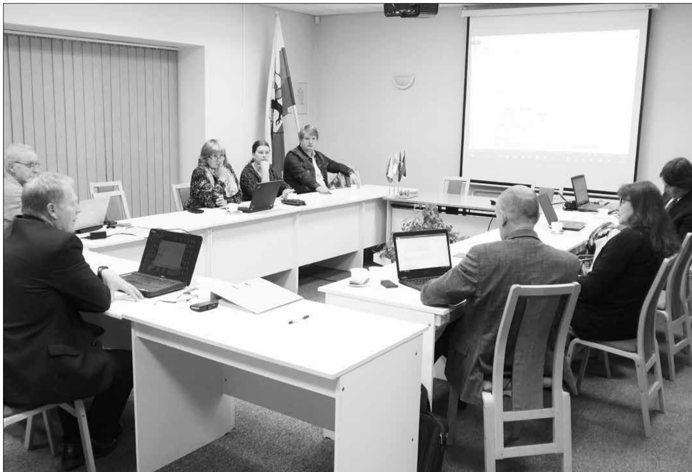
Ühinemise juhtkomisjoni koosolek Tamsalu vallamajas.

Tapa valla ning Tamsalu valla ühinemine toimub 2017. aasta kohaliku omavalitsuste