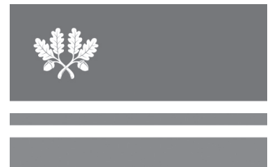
Tapa valla lipp.