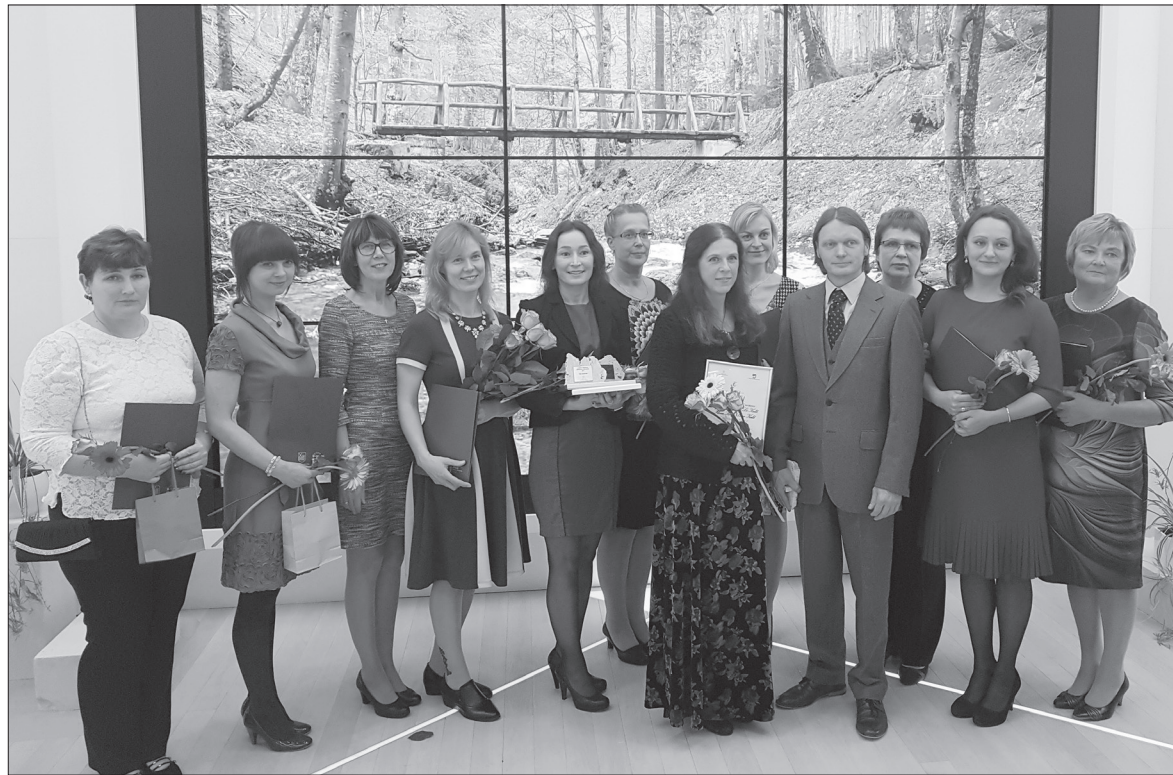
Lääne-Virumaa õpetajate gala toimus Rakveres 4. oktoobril.

Lehtede ja okste äraandmiseks palume end registreerida e-posti aadressil krista.pukk@tapa.ee või telefonil 322 9665. Registreerimine toimub 16. oktoobrist kuni 26. oktoobrini 2017. tapa.ee