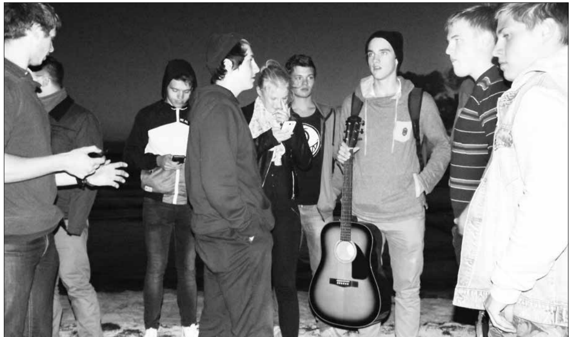
Noored muinastulede ööl Kloogarannas.

Sõnumed toimetuse vabandab autori ees, et artikkel, mis oli kavandatud avaldamiseks ajalehe juuninumbris, näeb trükiavalgust alles septembris.