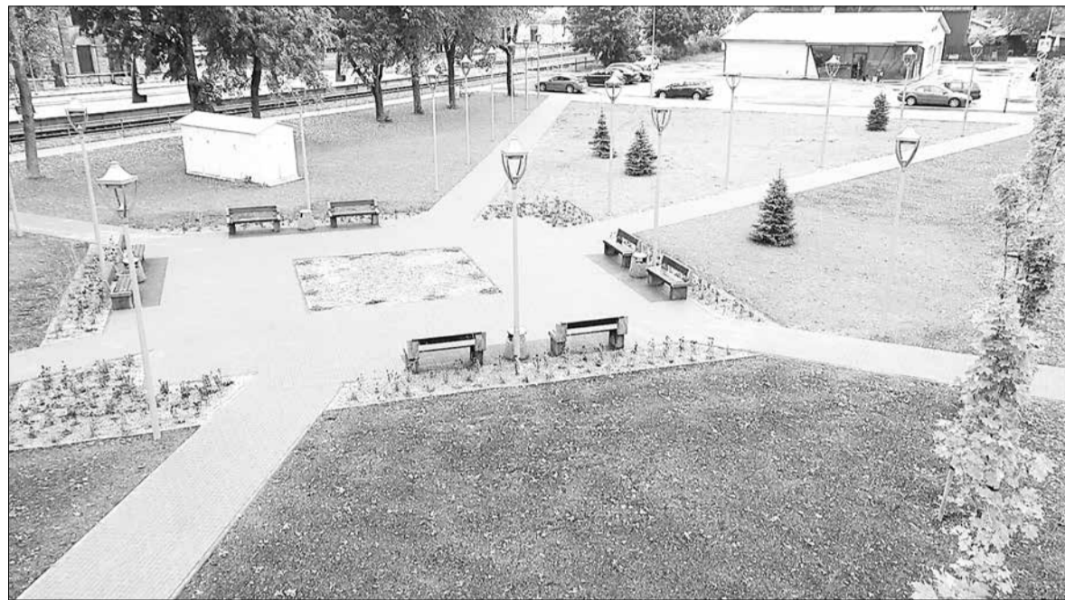
Renoveeritud Jaama park valvekaamerast nähtuna.