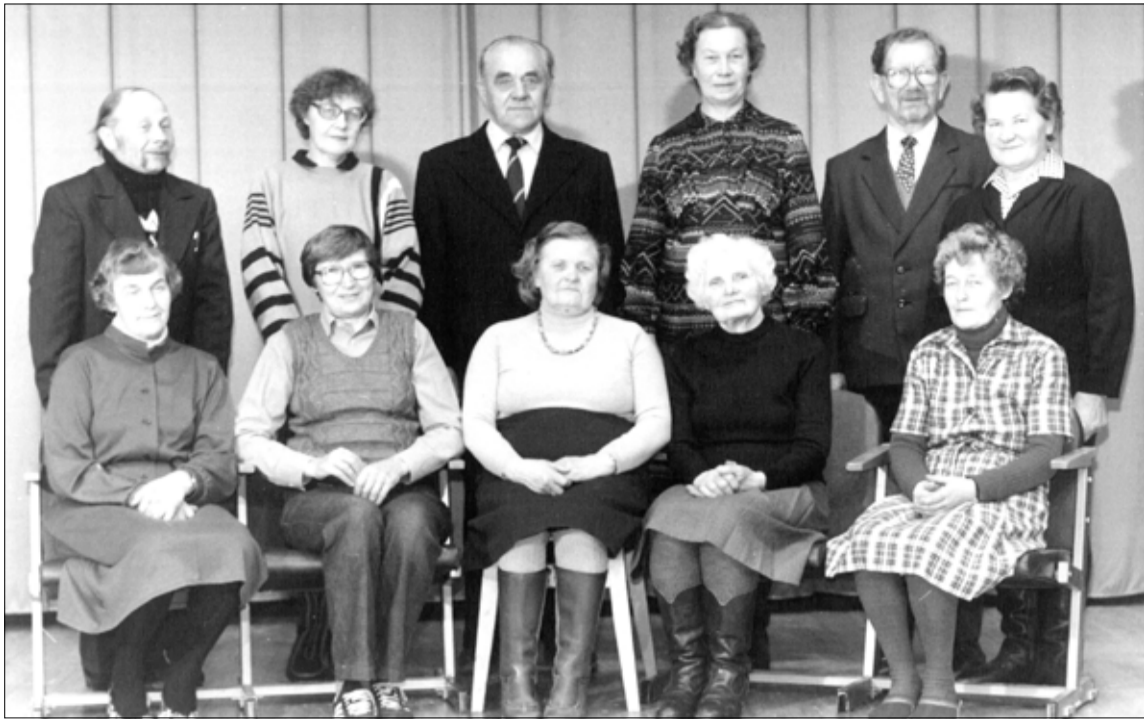
Ekate klubi Ehavalguse eelkäijaks oli 1984. aastal moodustatud 11-liikmeline Lehtse tööveteranide nõukogu.