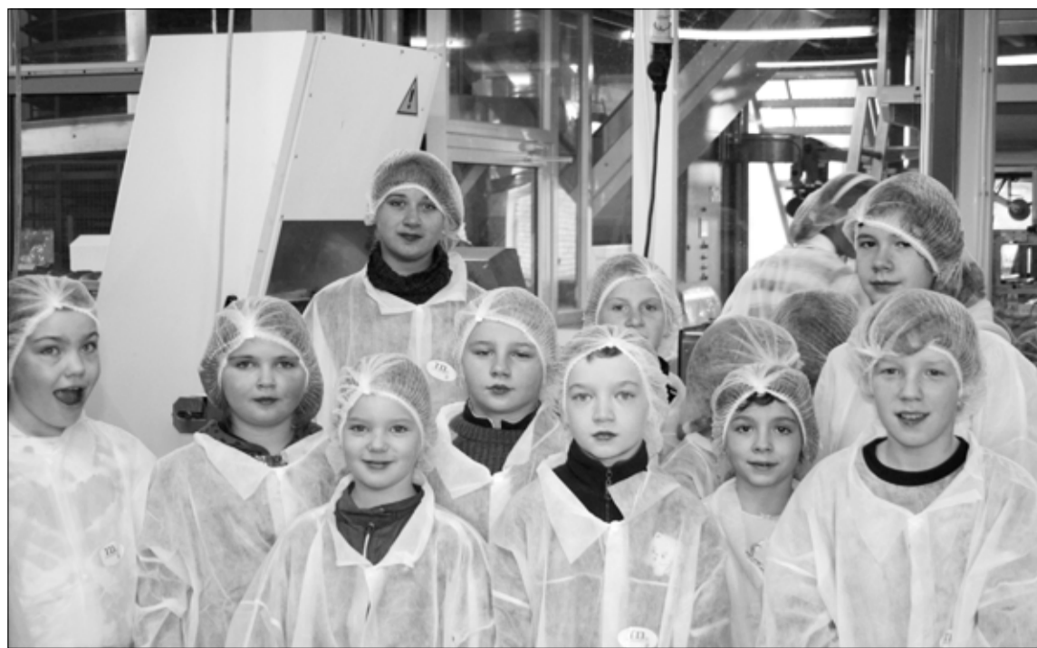
Vene gümnaasiumi õpilased käisid leivanädalal ekskursioonil leivatehases.