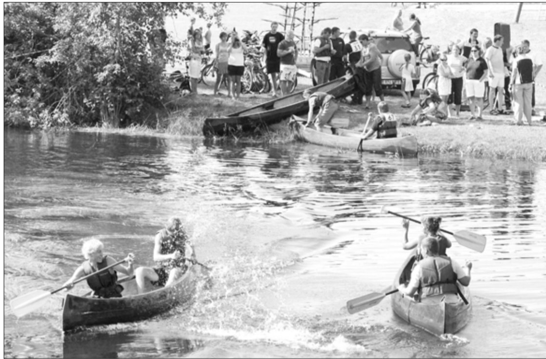
Kanuurallil osalejate soojendussõitudes oli juba näha lõbusat pinget konkureerivate võistkondade vahel.