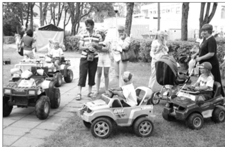
Muusikakooli taga pargis oli lastel võimalus sõita elektriautode ja ATV-dega.

Vahvaid tegemisi ja rahvast jagus kõikjale: erinevad näitused kultuurikojas ja muuseumis, lastele mõeldud atraktsioonid, võistlus “Tapa linna ilusama krants”, saalihoki miniturniir spordikeskuses, Valgejõe saarel rannavolle, rannamaadlus ja kanuuralli ning sporditäika. Pühapäevane Kihnu Virve esinemine koos Järsumäe pereansambliga oli mõnusaks finessiks, millega ühtlasi ka Tapa linna sünnipäevapidu mär-