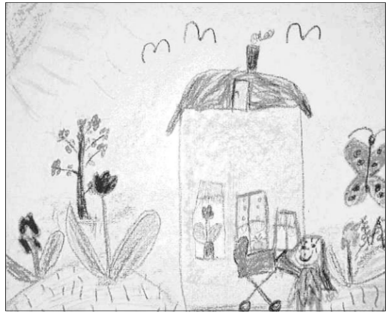
Trükise esikaane illustratsioon.

Hea lapsevanem huvitub oma lapse käekäigust, on pidevalt teadlik oma lapse õpitulemustest ja tegelemistest ning osaleb lapse ja pere abistamisprotsessis.