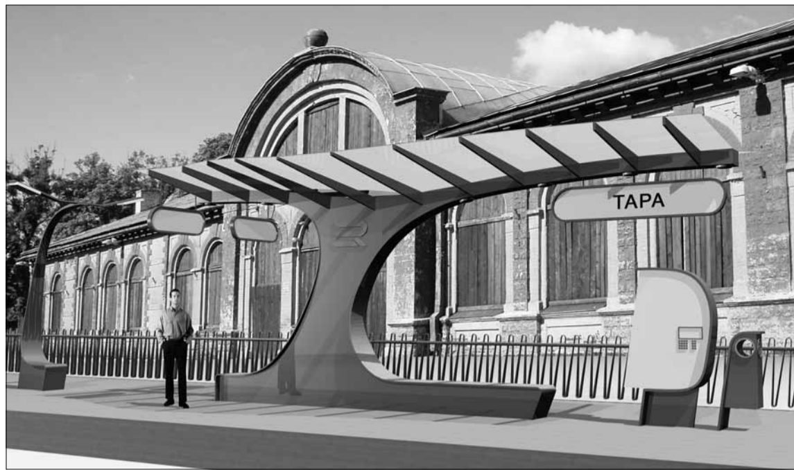
Kas vaksali perroon koos varikatusega hakkab tulevikus välja nägema fotol kujutatuna?

Graafika arhitektuuribüroo Luhse & Tuhal, Liina Kald