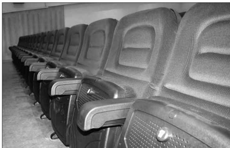
Saalitoolid saabusid Tapale Hispaaniast.