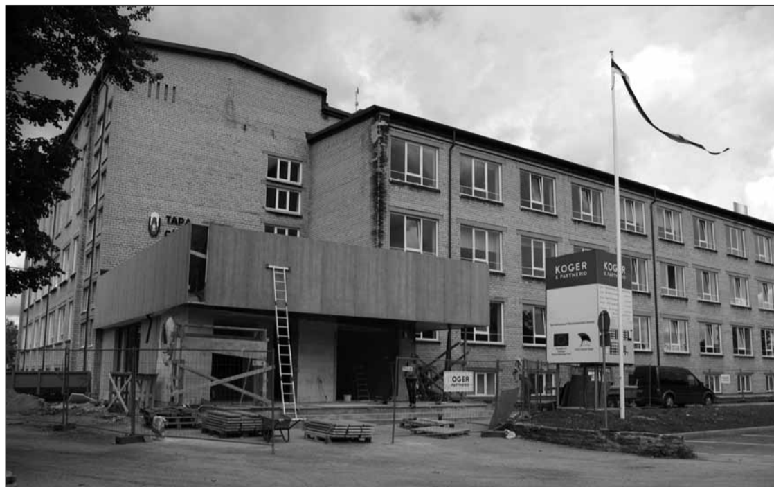
31. augustil käis veel vilgas ehitustegevus Tapa gümnaasiumile uue ilme andmiseks.