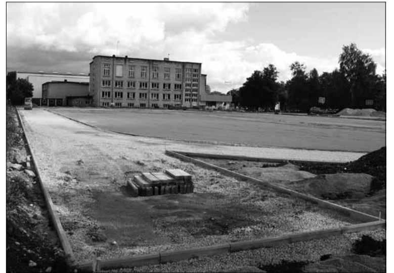
Pärast renoveerimist saab gümnaasiumi staadion täielikult uue ilme.

Kooli staadioni osas on tegemist täiesti uue ehitusega, mis on projekteeritud ja ehitatud kaasaja nõudeid ja vajadusi silmas pidades. Staadion paikneb vana staadioni kohal ning hõlmab endas jalgpallväljakut, mida