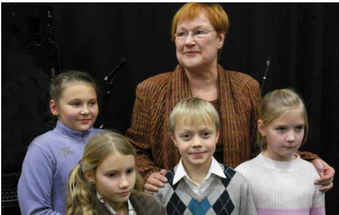
Soome president Tarja Halonen koos Tapa gümnaasiumi õpilastega.