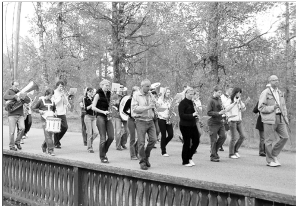
Tapa Linna Orkester Rootsivõimlemist harjutamas.