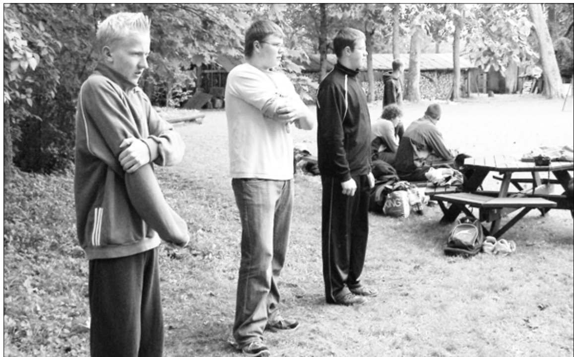
Võistlejad oma tõeajajärgkorda ootamas.