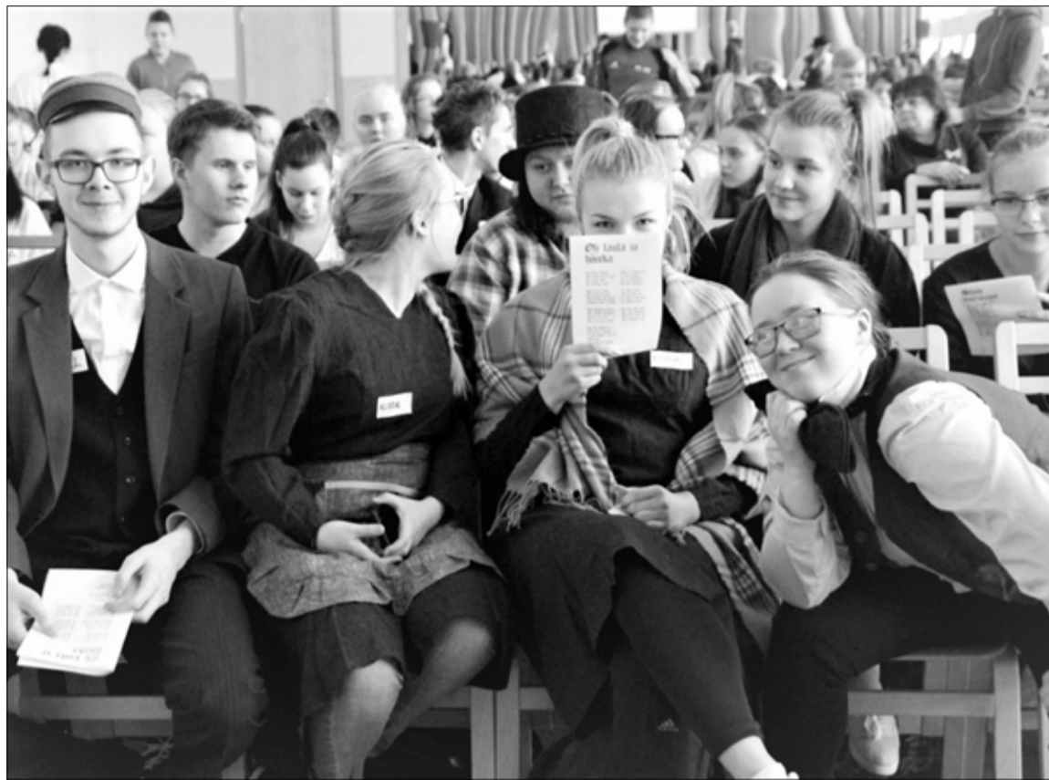
“Ajarännak” – Tamsalu gümnaasiumi 12. klassi õpilased kooriproovi kogunemisel. Loe täpsemalt lk 6.