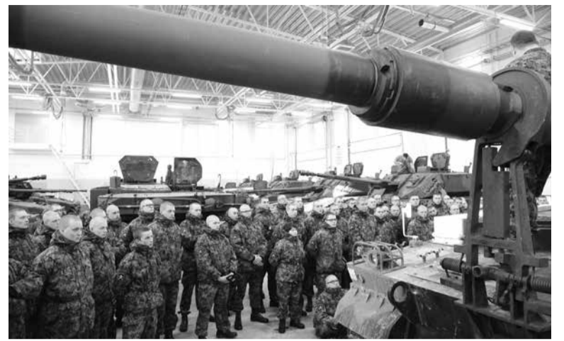
Современное военное дело требует постоянного обновления вооружения.

K9 Thunder - новейшая южнокорейская 155-мм самоходно-артиллерийская установка. Башня и корпус гаубицы сделаны из листов стальной катаной брони. Эта броня обеспечивает защиту экипажа от огня стрелкового оружия, а также осколков мин и снарядов. В состав экипажа входит командир, механик-водитель, наводчик и два заряжающих. K9 Thunder оснащена системой защиты от оружия массового поражения, обогревателем, средствами связи, противопожарной системой и