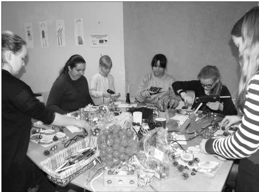
Хорошо, когда красота создается своими руками.