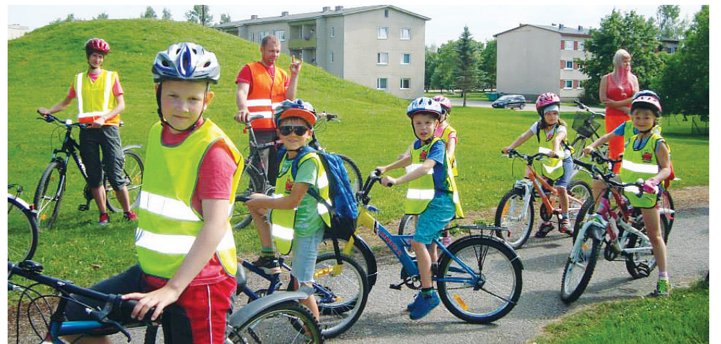
Matka algus, kogunemine

Lääne-Virumaa Spordiklubi Kalev treener ja Tamsalu Lasteaed Krõlli liikumisringi juhendaja.