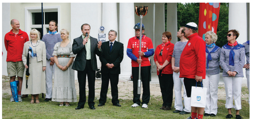
Võhmuta mõisa väravas toimus maakonnavahtus. Tuli lahkus lõplikult Lääne-Virumaalt ja jõudis Järvamaale