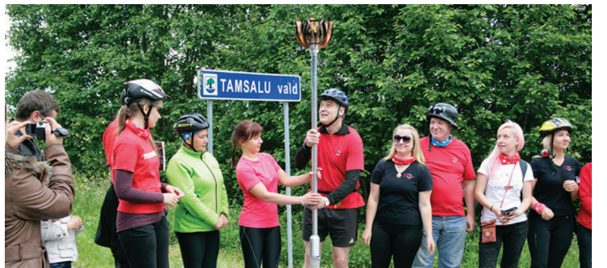
Rakke vallalt saadud tuli käis käest kätte, et kõik sellest osa saaksid