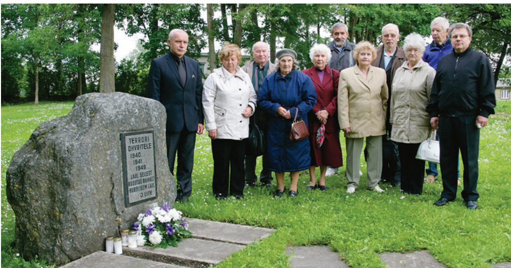
Tamsalus represseeritute mälestuskivi juures