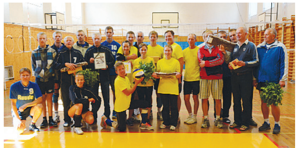
Perekonnad Annus, Püvi ja Vants Tamsalu Gümnaasiumi võimlas