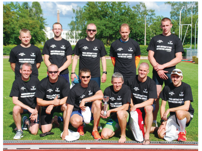
Kümnevõistlejad võistluste avamisel

Registreeritud oli kokku 11 võistlejat, kes kõik ka võistluse lõpetasid.