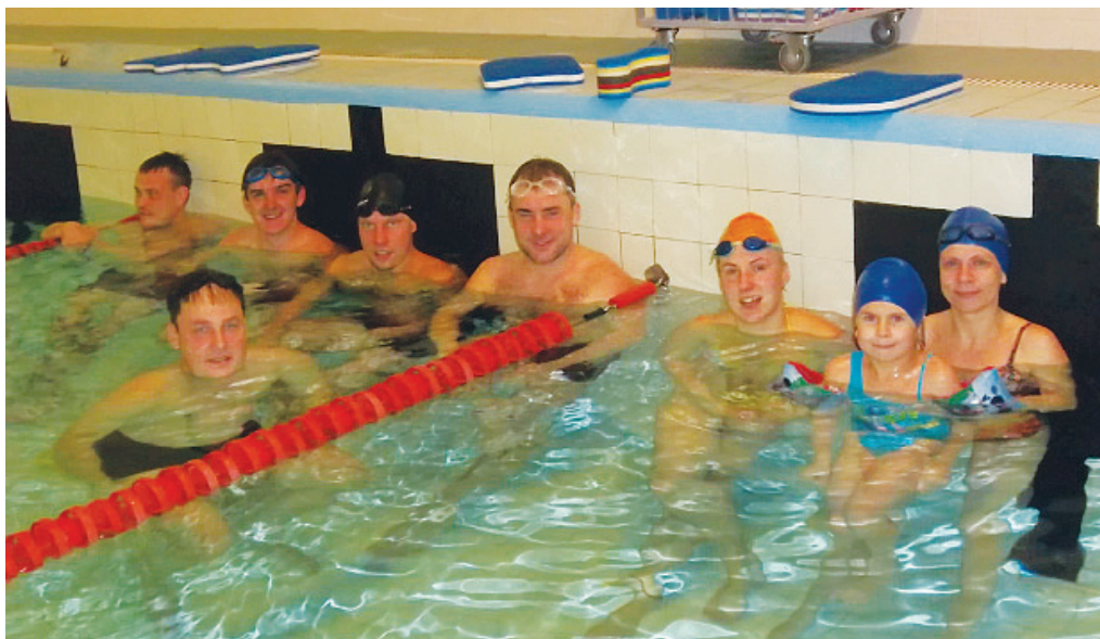
Täiskasvanute kursus detsembris 2013

Täiskasvanute ujumiskursustel möödus kuues hooaeg. Alustas möödunud hooajal 9 õpilast. Kõik nad olid erinevate oskustega.