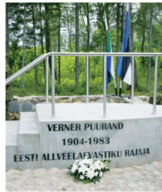
Mälestusmärk on kujundatud allveelaeva komandosillana