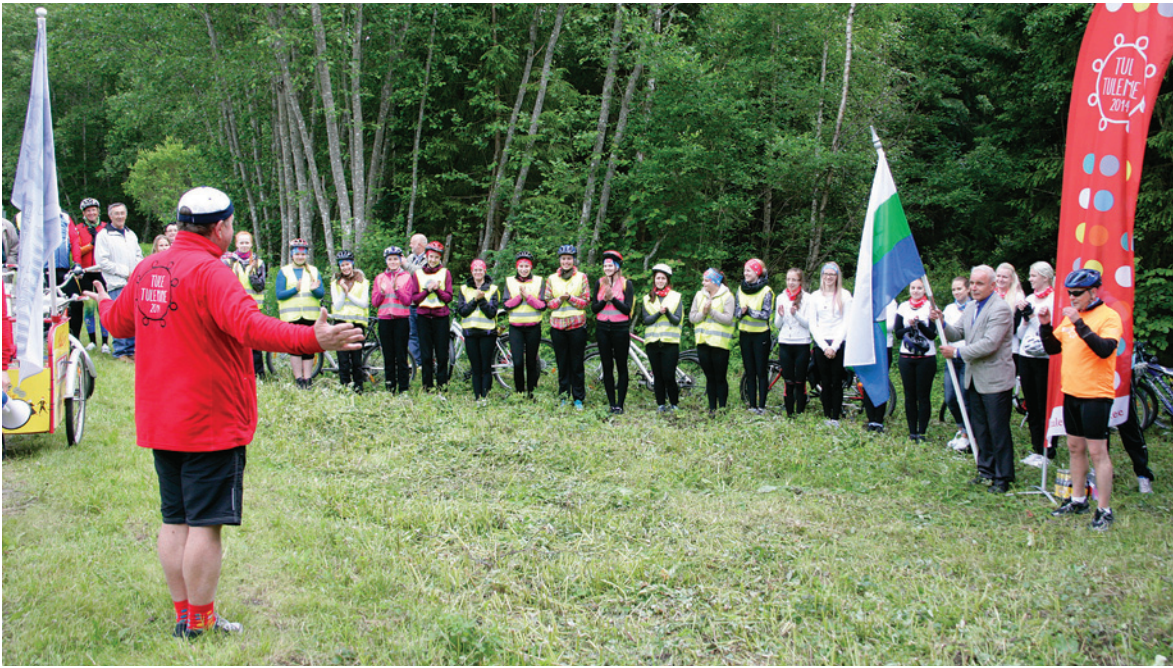
Esimene kohtumine laulupeotulega. Tule andis Tamsalu vallale üle Tapa vald