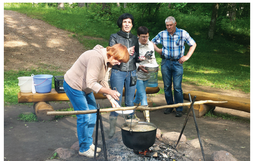
Läti õuesupp päeva lõpus