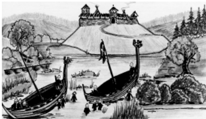
Viikingid Porkuni all

Aastatel 1525-58 elasid siin Tallinnast välja saadetud dominiiklastest mungad. 1558.a oli linnus venelaste valduses ja purustati. 1561.a, mil linnus oli Rootsi kuninga valduses, viimane lammutati ja Rootsi revisjonikirjades seda enam