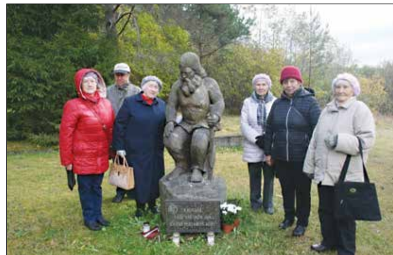
Tamsalu Murtud Rukkilille Ühingu liikmed EESTI KODU monumenti ja kodumaale naasnud peremehe mälestussamba juures.

grillvorstikesi, salatit ja morssi. Kuumad vorstikesed maitsesid kõigile hästi ja meeleolu oli mõnusalt ülev. Sõbralikult vesteldes möödus aeg kiiresti. Kuna ilm oli jahedavõitu, siis oli soovijail võimalus kuulata ja ka maitsta „metsakohinat“! Metsavendade mälestuspäeva kava oli koostatud asjatundlikult ja kõik sujus tõrgeteta. Siiski saabus aeg asuda koduteele.