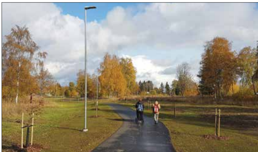
Улица Лембиту в г. Тапа: все это сделано на народные деньги!