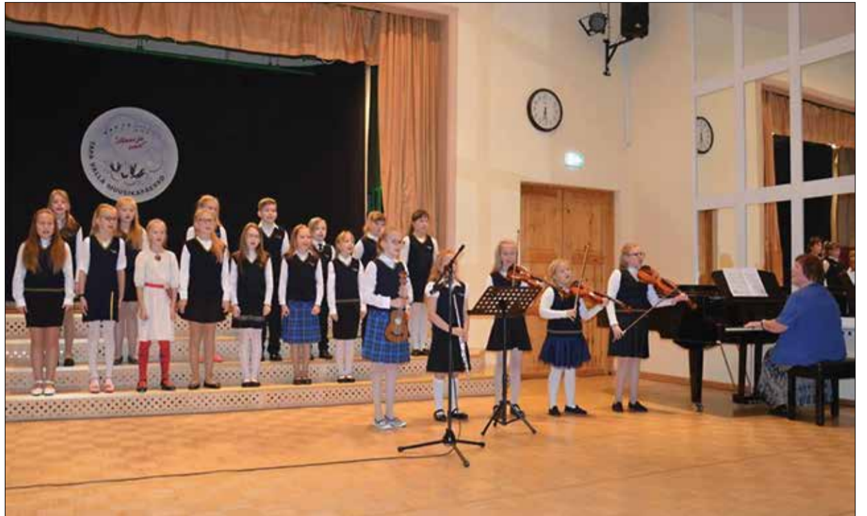
XII Tapa valla muusikapäevade lastekontsert.