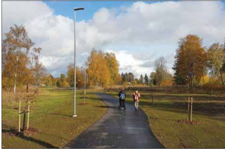
Kõnnitee moodub kaarega sealasuvatest erakinnistutest.