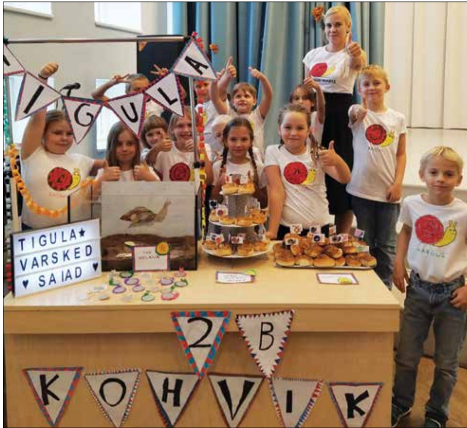
Tamsalu Gümnaasiumi 2. klass müüs mihklilaadal ise valmistatud saia.

Kindlasti muudavad sellised väikesed klassisisesed projektid koolielu huvitavamaks ja õppimine toimub iseenesest. Lapsed saavad tegutseda ühtse meeskonnana ning õpivad üksteiselt, saavad rakendada ideid ja on kindlasti ettevõtlikud!