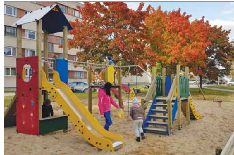
Современные игровые площадки красивы и безопасны.

Теперь в Тамсалу возле жилых домов на улице Ээси установлена новая детская игровая площадка с современными аттракционами. Оборудование предыдущей детской площадки устарело и требовало замены. Старые аттракционы износились и были для детей уже неинтересными, некоторые аттракционы представляли опасность. В связи с этим волостная управа приняла решение построить и оборудовать этим летом новую детскую площадку. Теперь здесь установлены новые и современные аттракционы, которые интересны детям. Основанием всей территории площадки яв-