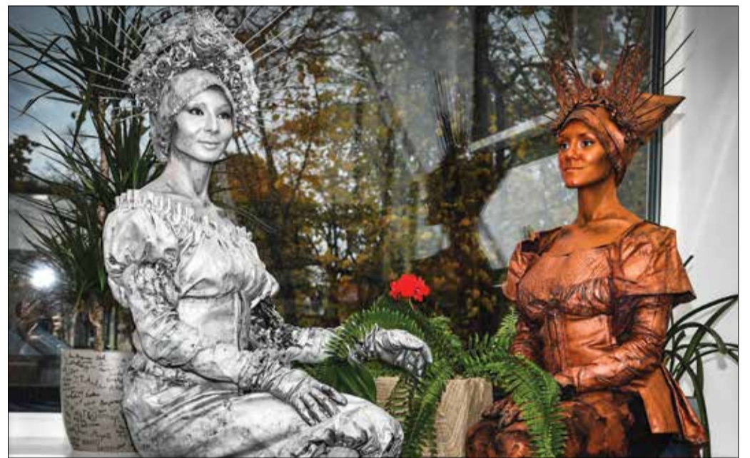
Avamispeole lisasid metalset sära imelised näitlejad.