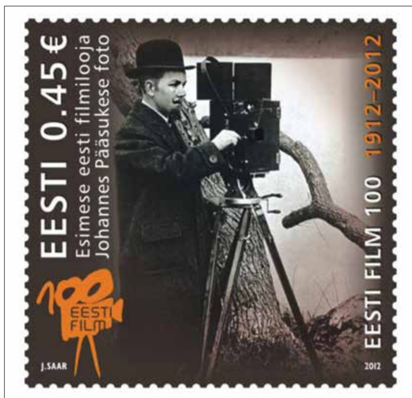
Юбилейный выпуск Почты Эстонии - 100 лет эстонского кино.

Замечайте лучших людей! Они заслужили награды!