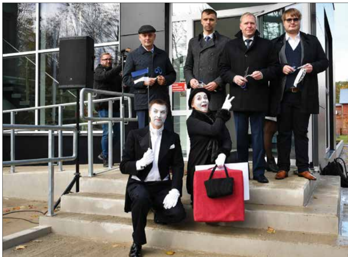
Торжественное мгновение открытия реновированного Культурного центра.

Насыщенной кинопрограмме фестиваля «Kino maale», по традиции, предшествует время изучения азбуки анимации. В этот раз в Анимаакадемии «учились» 85 детей и 28 военнослужащих. Участники приехали из Тапа, Тамсалу, Пылтсама, Азери, Албу и Ору. Всего было подготовлено 35 краткометражных анимаций, общее время этой кинопродукции - около 20 минут. Кинофестиваль «Kino maale» продлится до 27 октября.