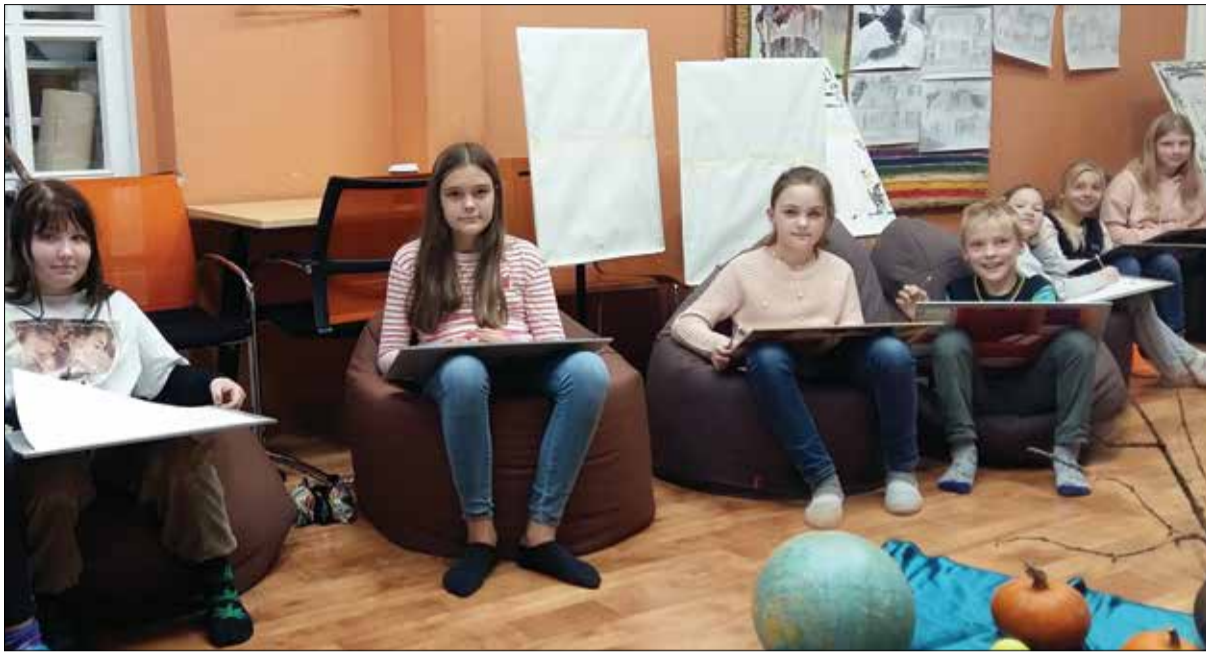
Kotte jagub nii koridori kui ka klassiruumi. Kunstiosakonna õpilased joonistamist alustamas.