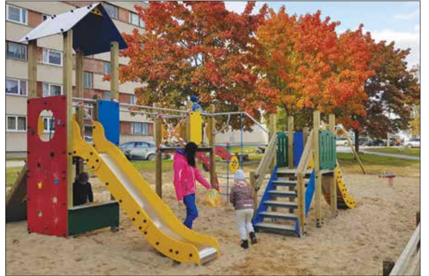
Mänguväljaku rajamise maksumus on 11 743 eurot koos käibemaksuga.