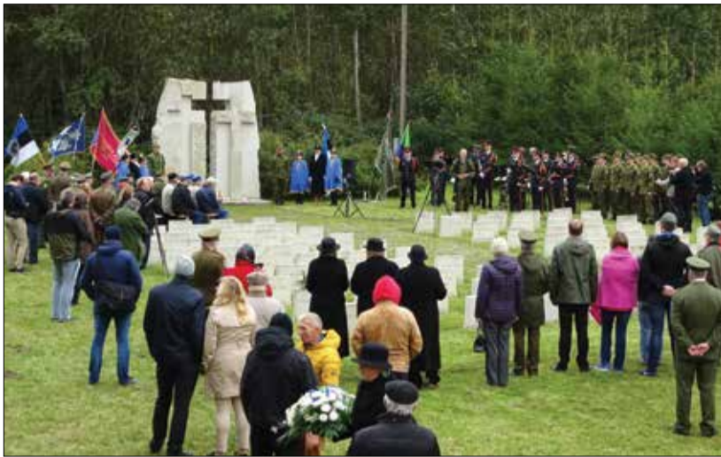
Mälestustalitus Vistla memoriaalis.

Porkuni koolis toimus konvents, esitleti raamatut selles kurvast ajaloosündmusest, toimusid