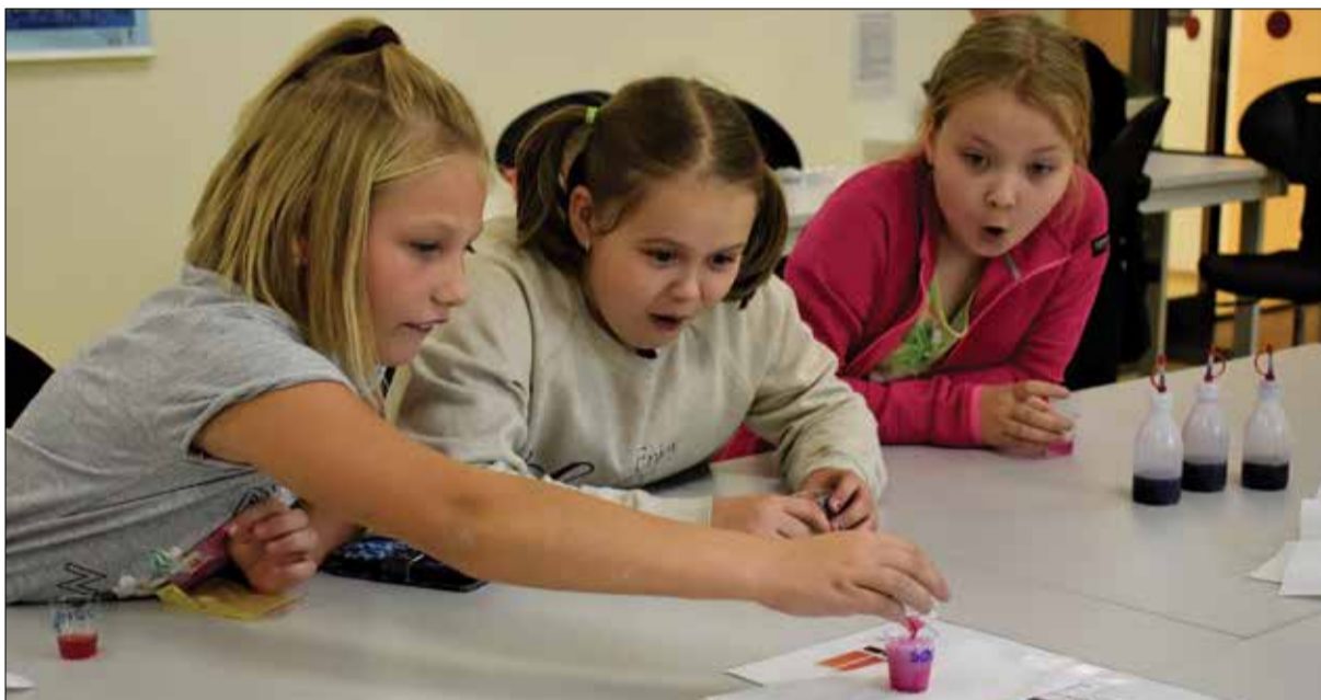
Teadusõhtu raames toimunud töötoad pakkusid lastele palju elamusi.

Suur tänu toreda koostöö eest Unilever Eesti AS-ile. Loodame, et saame kevadel ka suud magusaks!