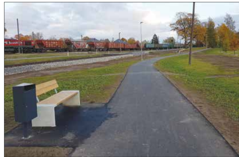
Улица Тёестусе - важная часть инфраструктуры г. Тамсалу.

Тамсалуской улицей Тёестусе мы занимаемся уже с 2017 года, когда была проведена реконструкция улицы средствами Тамсалуской волости. Затем реконструкция продолжилась в 2018 году на отрезке длиной 320 метров. Здесь проложено новое