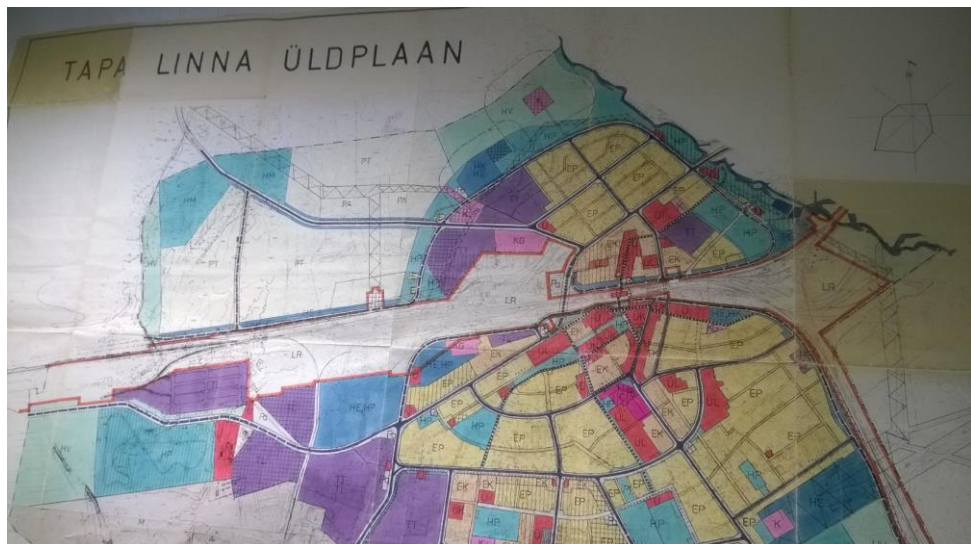
Foto 1. Väljavõte Tapa linna generaalplaanist (kehtiv üldplaneeringuna)

Endise Tamsalu valla osas kehtib Tamsalu valla üldplaneering (kehtestatud 19.05.2010 Tamsalu Vallavolikogu määrusega nr 6).