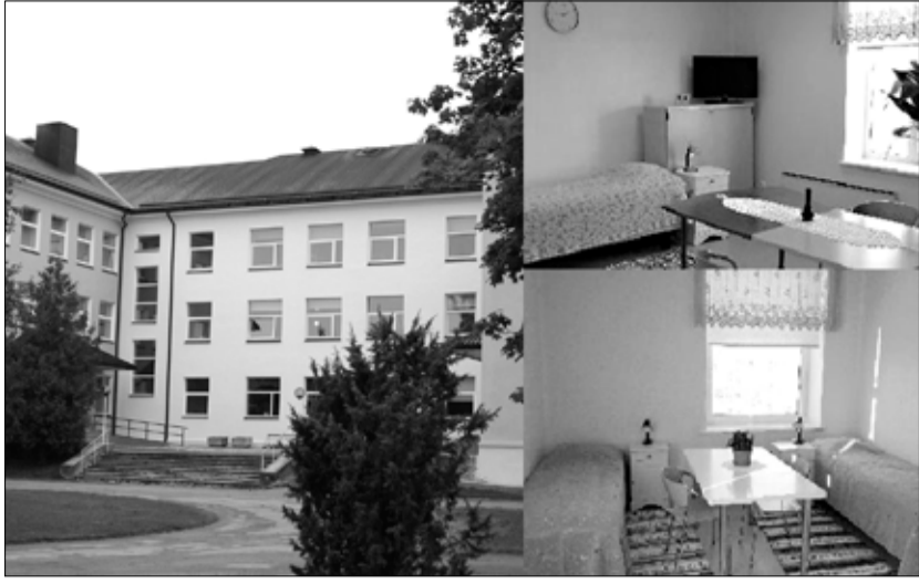
Тапаская больница все больше становится современным социальным центром.