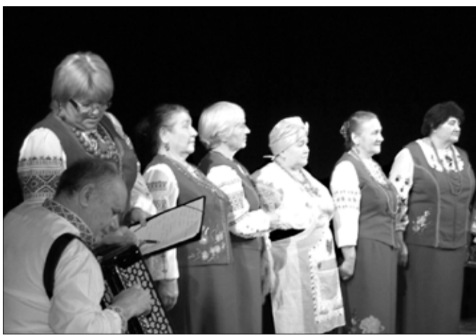
Песня помогает хранить национальные корни.

Этими словами начались рождественские встречи, которые проводило в начале января в городе Тапа украинское общество «Червона рута». Поздравления с праздниками и рождественские колядки в исполнении хора «Журавушки» звучали озорно и интересно, так как звучат они на Украине. Были исполнены песни «Хай святкує з нами вся наша родина» «Вся наша