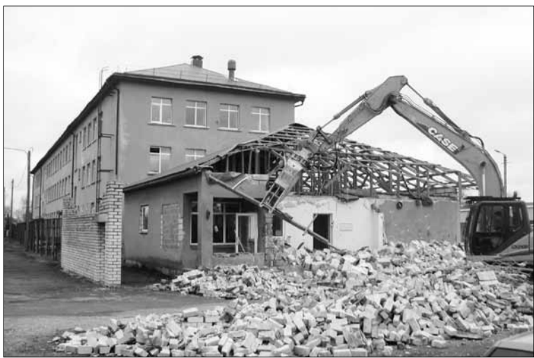
Комплекс зданий Тапаской Спецшколы ждет полное обновление. Работы уже начались

Кукк признала допущенные ошибки в управлении школой. Последним рабочим днем Кукк было 14 марта. В связи с намечаемым объединением спецшкол Тапа, Каагвере и Вастселийна нового директора для учебного заведения искать не стали.