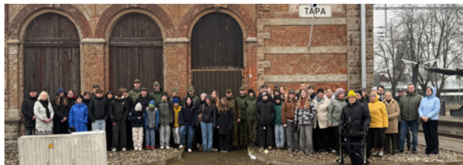
25. märtsil mälestati märtsiküüditamise ohvreid Tamsalus mälestuskivi juures ning Tapa jaamahoone ees toimunud mälestushetkedel. Peeti kõnesid, asetati lilli ja süüdati küünlaid, et austada 1949. aasta traagiliste sündmuste ohvreid.