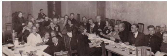
Näitekursuse lõpetamine teeõhtuga rahvamaja saalis.