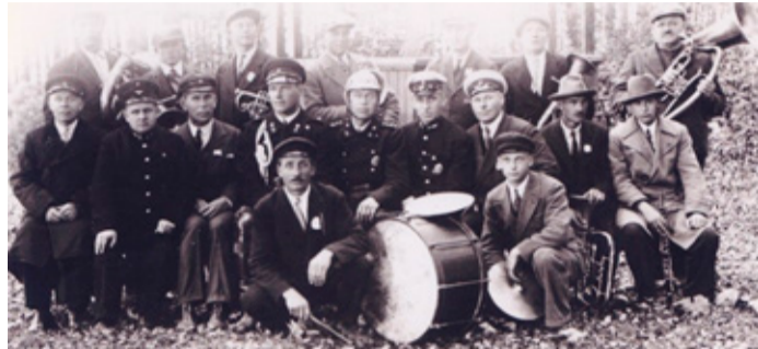
Tamsalu pasunamehed 24. juuli 1932.