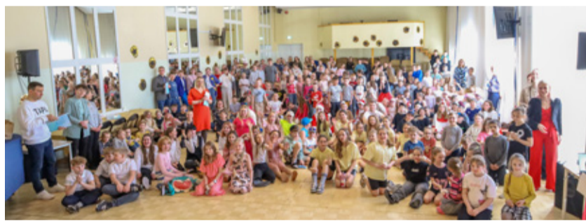
Playbox 2026 osalejad.

Lehtse koolimaja külastas märtsis Ameerika Ühendriikidest pärit teks-