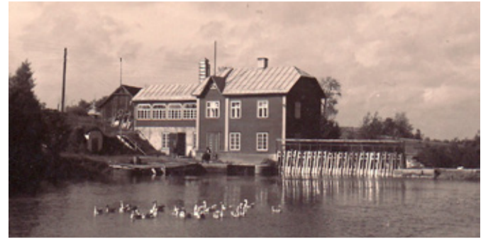
Tapa elektrijaam 1930. aastatel.

Selleks otsustas maakonnavalitsus alevivalitsuste kaudu igale hääleõiguslikule alevikodanikule kätte toimetada