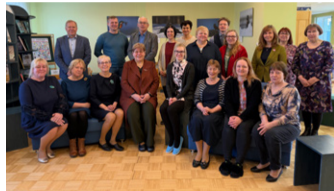
Kersti viimasel tööpäeval koos sõprade ja kolleegidega.

Ja nagu Kersti ise lõpetab – „Kohtume raamatukogus!“ – seekord juba lugejana.