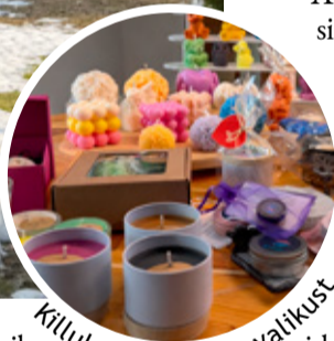
Kiluke Sixpi tootevalikust.

Võib-olla peitubki nende loo suurim väärtus just selles, et kõik saab alguse kodust ja kui tehtud on südamega, leiab see tee ka teisteni.